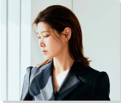
고상지 | 반도네온 |